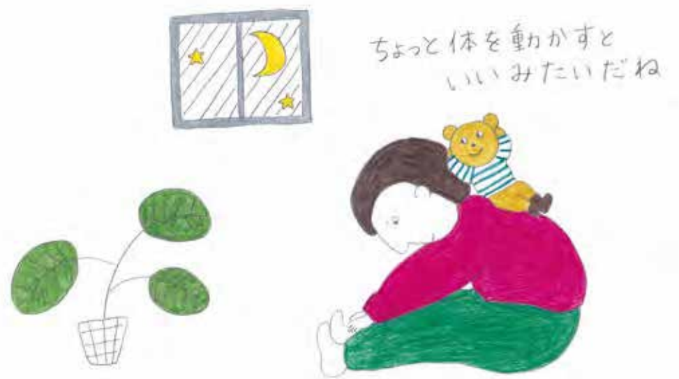
イラストレーション：堺直子

なお、PMSの諸症状を緩和する一般薬（薬局で購入できる薬）もあるので薬剤師に相談するのもよいでしょう。