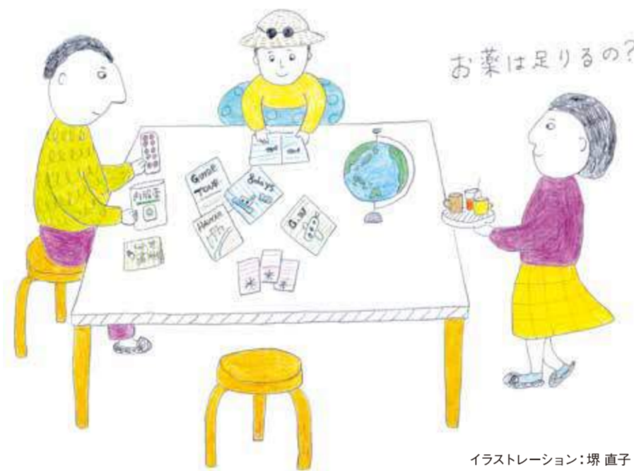
イラストレーション: 堀直子

そのほか、GW中の対応について不安なことやわからないことがありましたら薬剤師に気軽に相談してください。