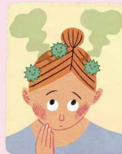
イラストレーション: ハラアツシ

頭皮から分泌される皮脂やフケをエサにして雑菌が繁殖すると、においを発生させます。原因の一つは誤ったシャンプー法です。中面の正しいシャンプー法を実践して、皮脂やフケを落としましょう。