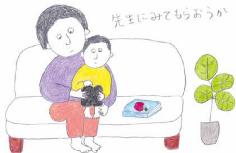
イラストレーション: 堀 直子

なお、水虫やイボについてわからないことがあるときは、薬剤師に気軽にお尋ねください。