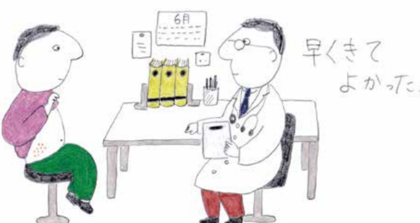
イラストレーション: 塚 直子